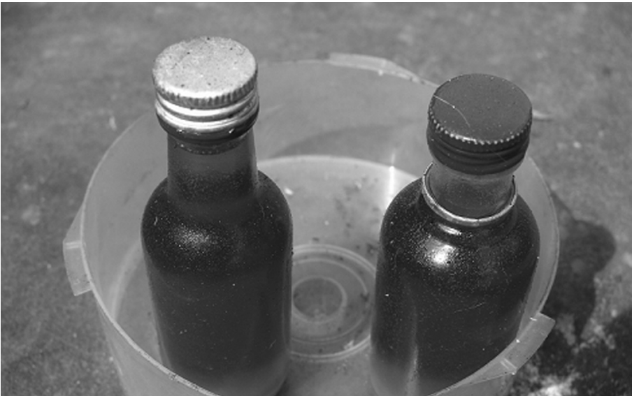
FIG. 2. Huile de Carapa telle qu'elle est vendue dans différents marchés de Dakar; 500 F CFA (0,80€) la bouteille.